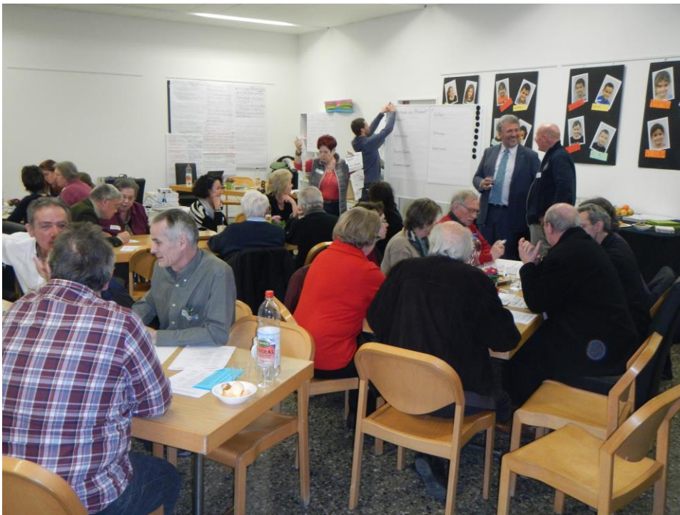
Engagierte TeilnehmerInnen an der Zukunftskonferenz mit mehreren Arbeitsgruppen