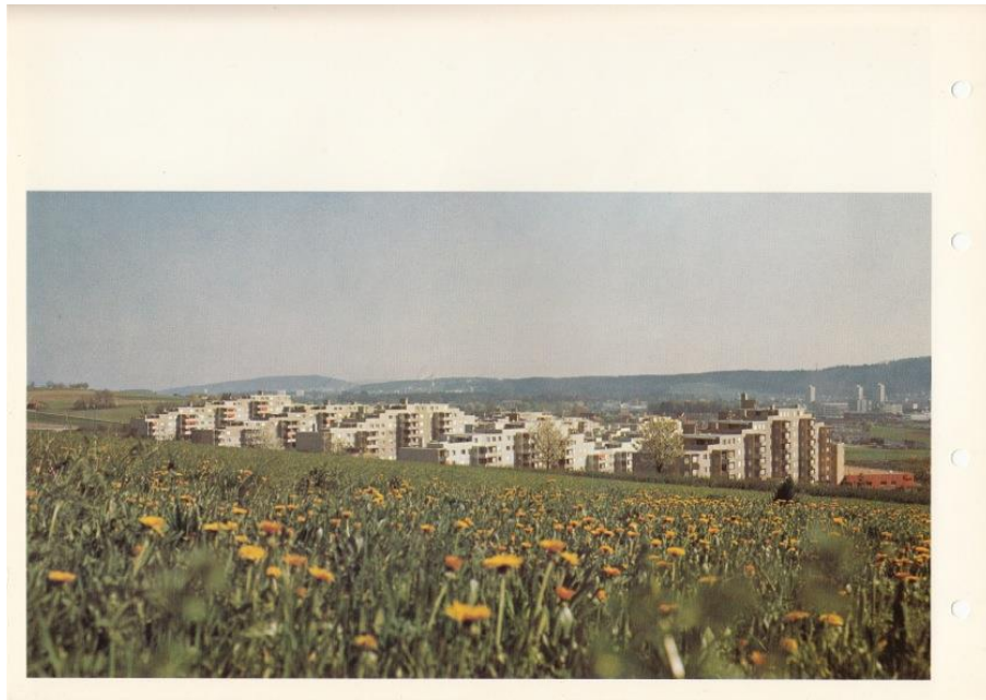
Das Quartier Sonnhalde in der Entstehungszeit in den 70er Jahren

Möge die weitere Umsetzungsphase mit dem gleichen Elan angegangen werden können.