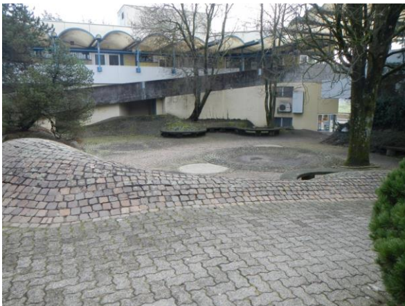
Sanierungsbedürftiges Zentrum mit stillgelegtem Brunnen

Bei den Liegenschaften und ihrer Umgebung haben meist die EigentümerInnen zu entscheiden. Auch sie haben ihre Unterstützung signalisiert.